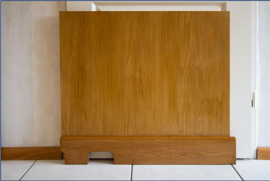
Het rechter zijpaneel, is voorzien van een gat voor de watertoevoer, afvoer en netwerkaansluiting.