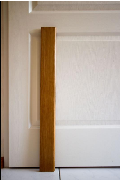
De linker bovenrand van de onderkast.