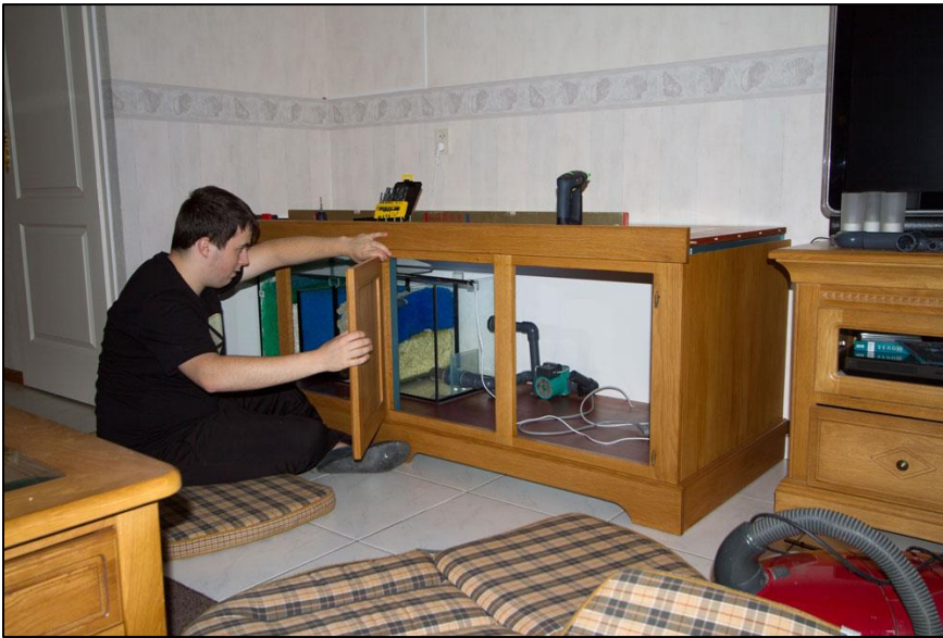
De deurtjes afhangen. De rechter bovenrand is nog niet geplaatst!