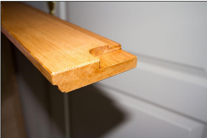
De rechter bovenrand van de onderkast.