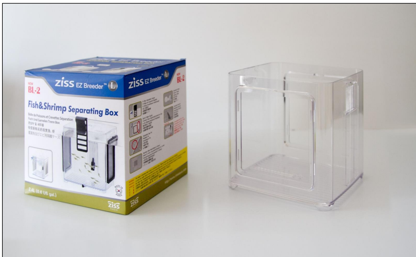
De verpakking en een lege kweekbak omhulsel.

Of je nu l-nummers, corydoras, guppy's, cichliden of garnalen kweekt, de Ziss Aqua kweekbakjes kan je naar behoefte samenstellen. De RVS roosters hebben een fijnmazig structuur, die niet alleen het fijne vuil doorlaat, maar ook de jongen in het kweekbakje houden. Het is zelfs mogelijk om er garnalen in te kweken, zolang je de bodem maar voorziet van een bodembedekking.