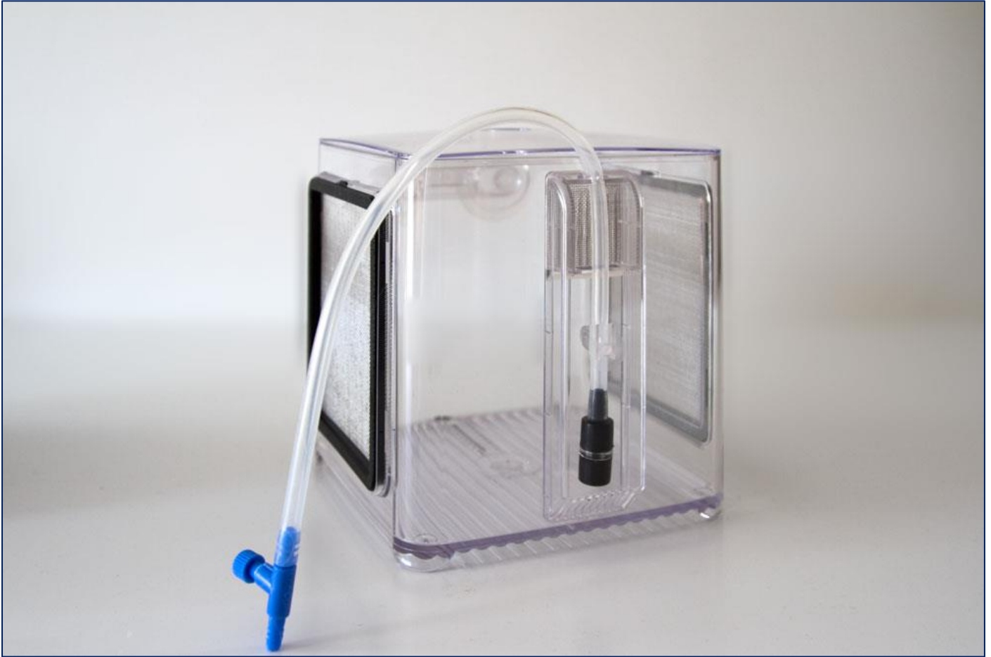
Het kweekbakje heeft een inwendige volume van 2,4 liter en de maten zijn: 13,5 x, 13,5 x 13,5 cm