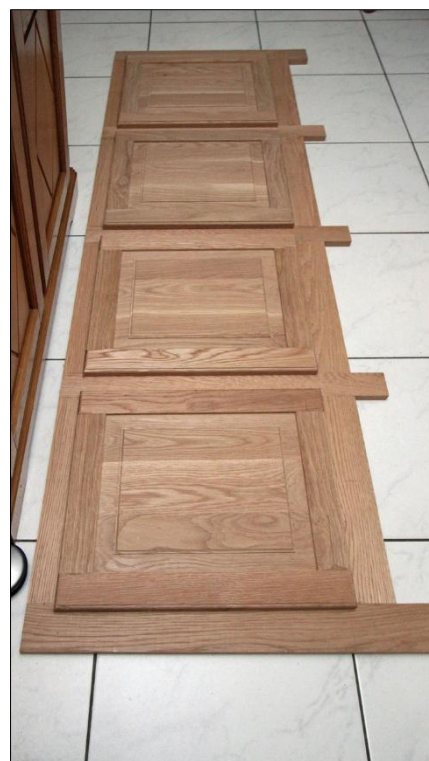
De volgende stap is deuren afhangen.