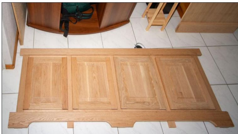
De boven- en onderplint zijn nog niet op de gewenste breedte gezaagd. Dit kan pas gebeuren als de zijpanelen op het stalen frame zijn geplaatst.

Niet is zo veranderlijk als de mens. Wil je het aquariummeubel een modernere look geven dan is het een kwestie van nieuwe voorpanelen, deurtjes en boven- en onderlijsten maken. De mogelijkheden zijn eigenlijk onbeperkt zolang je maar voldoende fantasie hebt of voorbeelden.