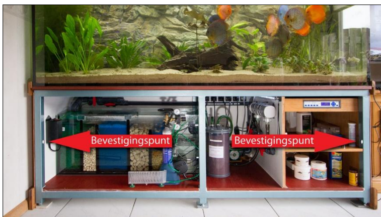
Alles is gemakkelijk toegankelijk zonder frontpaneel!

Het voorpaneel wordt met twee M4 verzonken metaalschroeven aan het stalen frame bevestigd. Op deze wijze kan je het voorpaneel eenvoudig vast- en losmaken. De schroeven zijn alleen zichtbaar als je de twee buitenste deurtjes open maakt!