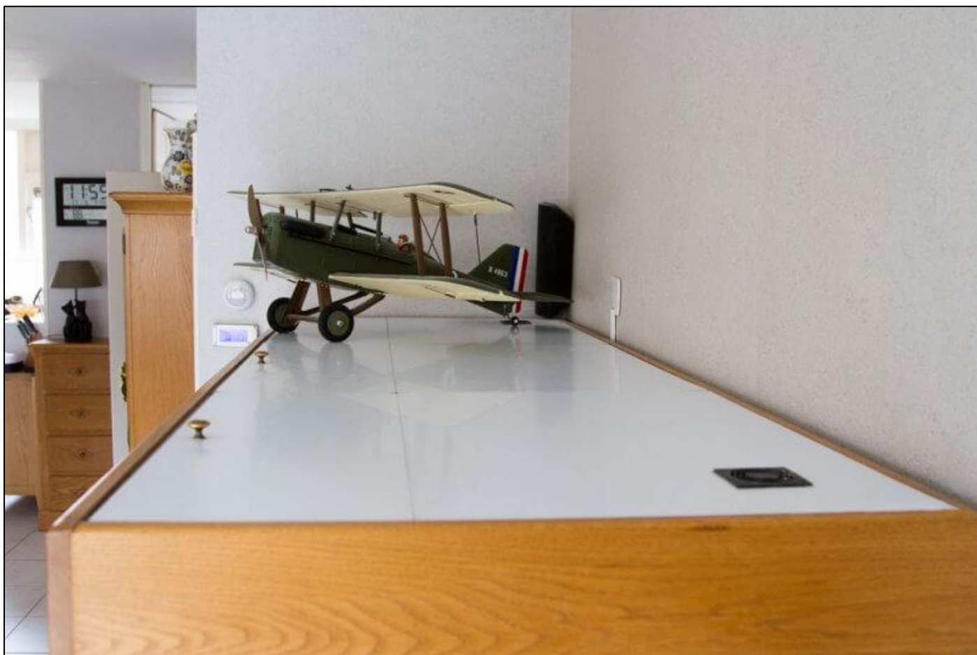
Een lichtgewicht lichtkap die zelfs een vliegtuig kan dragen

Om de kosten te drukken hebben wij besloten om de tweedelige eiken aquarium lichtkap deksels te vervangen door een zesdelige lichtgewicht Dibond® panelen.