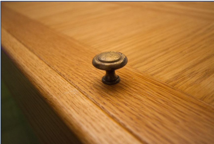
Het eerste onderdeel dat wij gekocht hadden waren de knopjes.