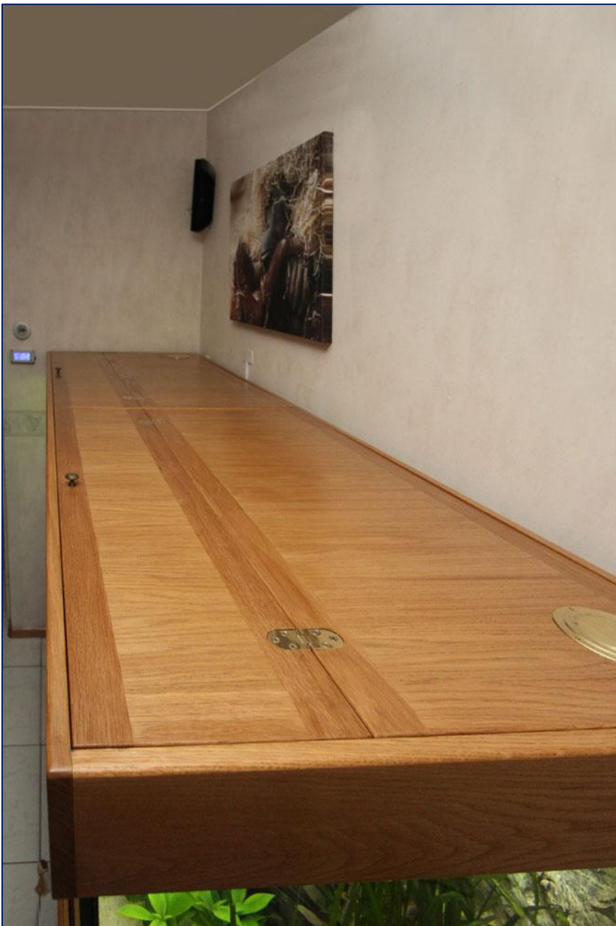
De twee bovenkleppen zijn gemakkelijk te open te klappen, voor onderhoud of het voeren van de vissen.