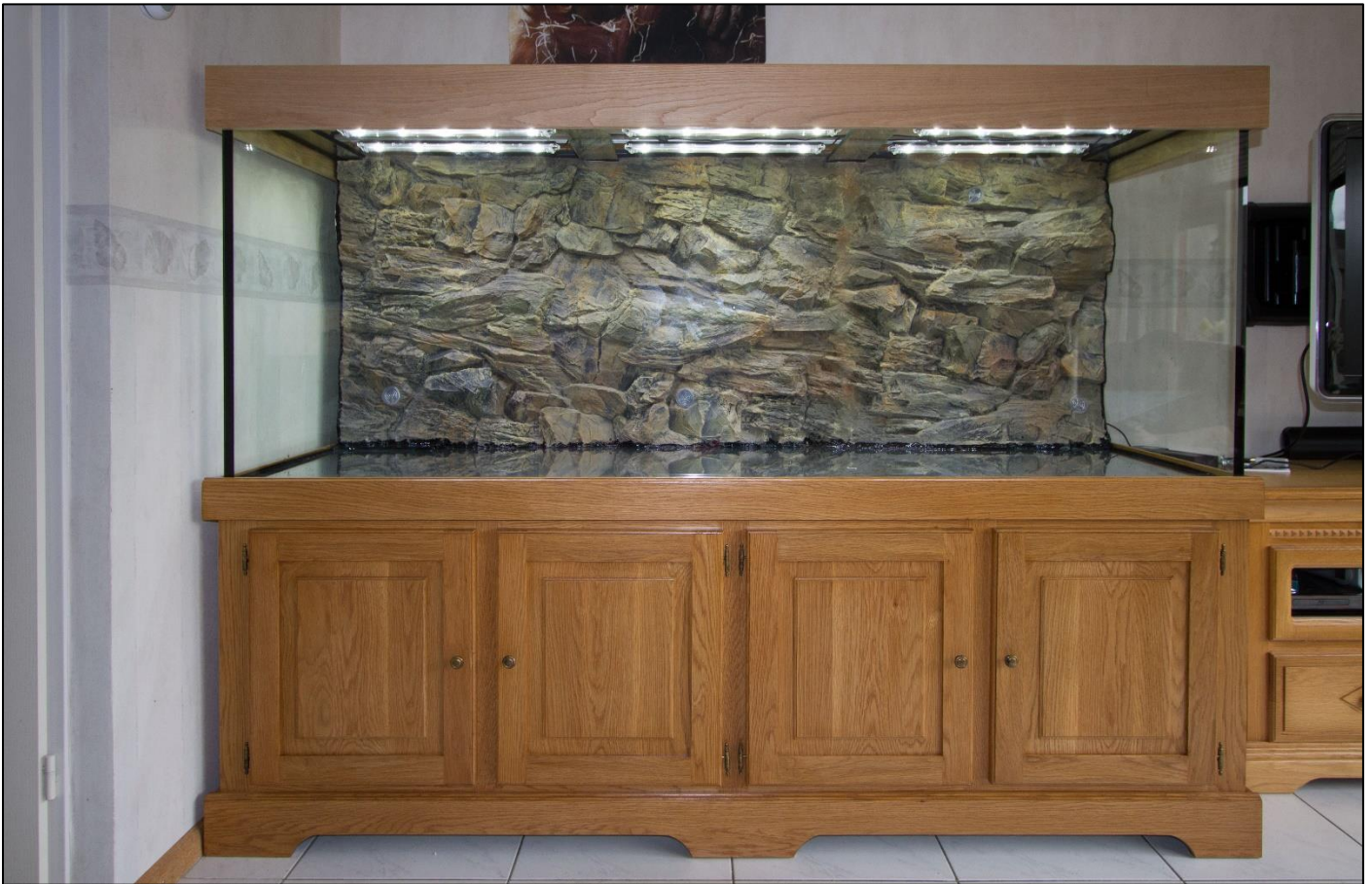
Het showaquarium is klaar, om ingericht te worden.