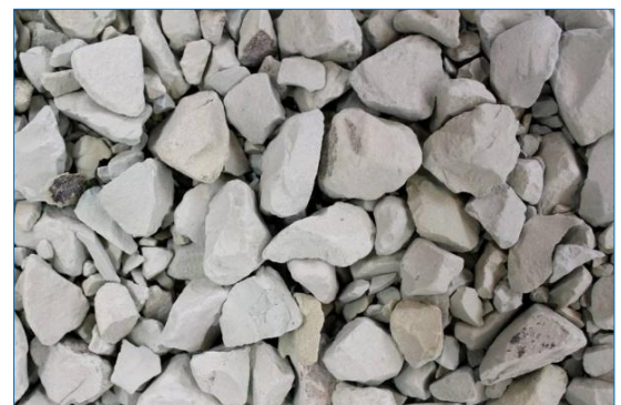
Let op: Glafoam is een drijvend product!

Intermezzo: Glafoam, een filtermateriaal dat sinds de jaren 90 wordt gebruikt, is samengesteld uit glas en oesterschelpen en vertoont eigenschappen die vergelijkbaar zijn met gesteente. Dit materiaal wordt door Japanse Koi-kwekers toegepast om de KH- en PH-waarden in vijvers te stabiliseren. Dankzij zijn lichte en poreuze structuur ondersteunt Glafoam effectief de groei en aanhechting van nuttige bacteriën.