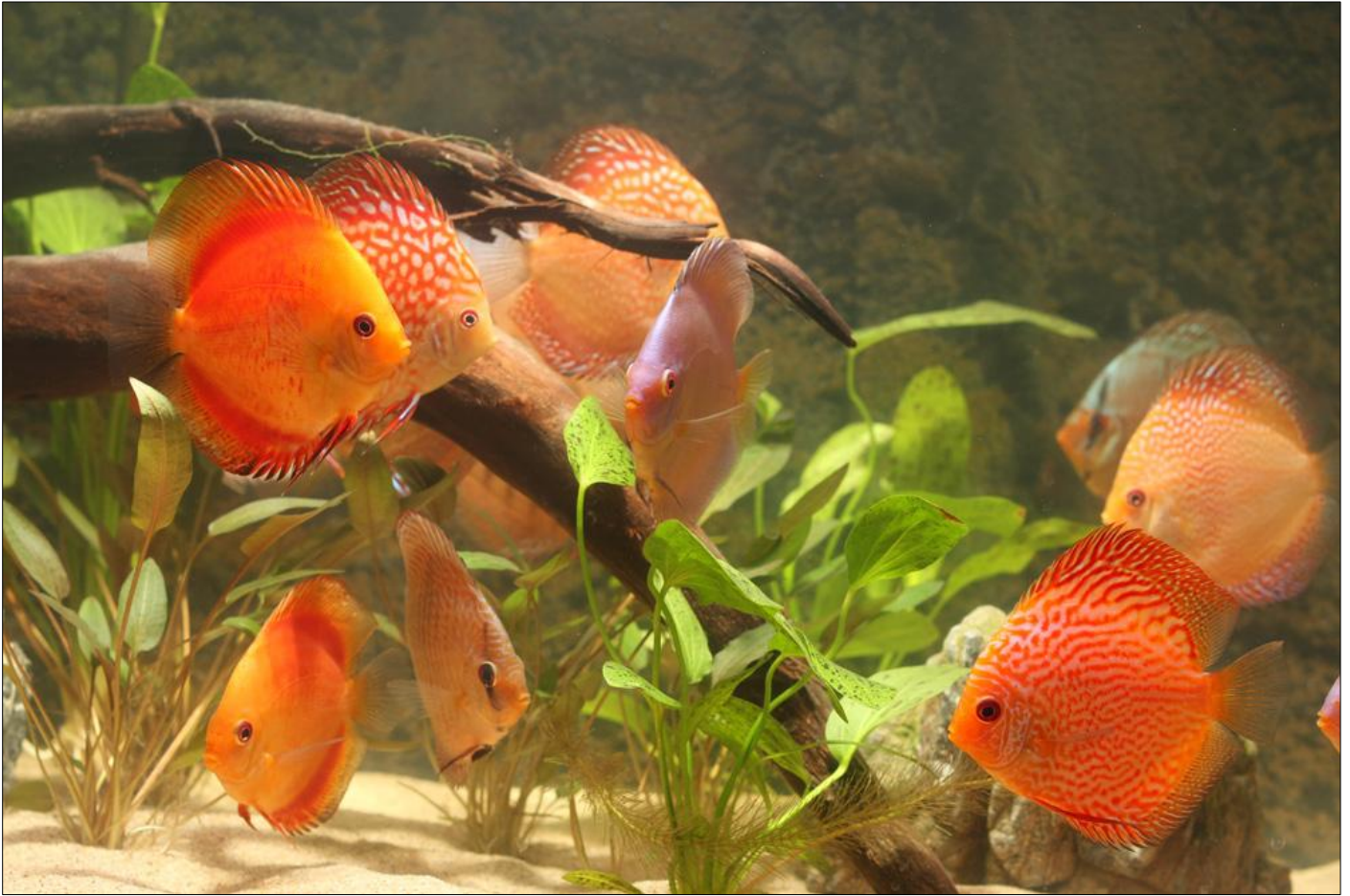
Verschillende kleurschakeringen die je in de natuur niet tegen komt.