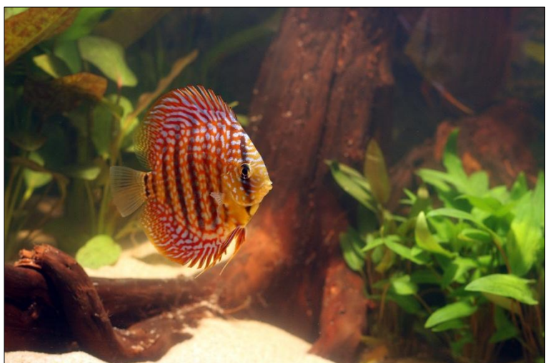
Een jonge Duitse discusvis