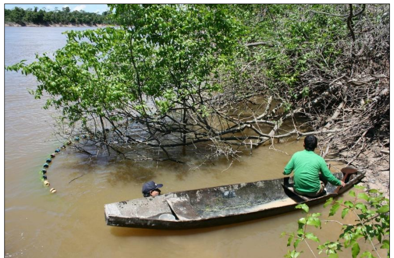
De discusvissen verschuilen zich graag tussen boomwortels

In het begin waren vooral de Duitsers actief in het nakweken. Zij zijn dan ook de pioniers in het ontwikkelen van nieuwe variaties.