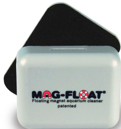
Handig als je niet overal bij kunt

Ook dit systeem heeft zijn nadelen. De mesjes zijn zo ingesteld dat ze 3 mm van de zijkanten zitten, dat is goed voor je siliconenkitrand, maar het gevolg is wel dat je de hoeken niet kunt schoonmaken. Wat je wel kan doen is de algenkrabber horizontaal te houden bij de randen. Je moet dan wel extra voorzichtig zijn, dat je niet in de siliconenkitrand raakt. Dit kan je alleen goed doen als de steel zo dicht mogelijk bij de mesjes vasthoudt. Maar dan is algenkrabber opeens niet meer zo handig. Voordat je het weet ga je de algenkrabber gebruiken als discus-keu. Biljarten is leuk maar niet met je discusvissen. Ook met dit systeem is de onderste gedeelte van het aquarium verboden gebied. Bovendien moet je de mesjes regelmatig vervangen, want ze slijten echt!. Elke zand of grindkorrel