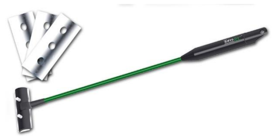
Dit type algenkrabber kan aan de onderkant scharnieren.