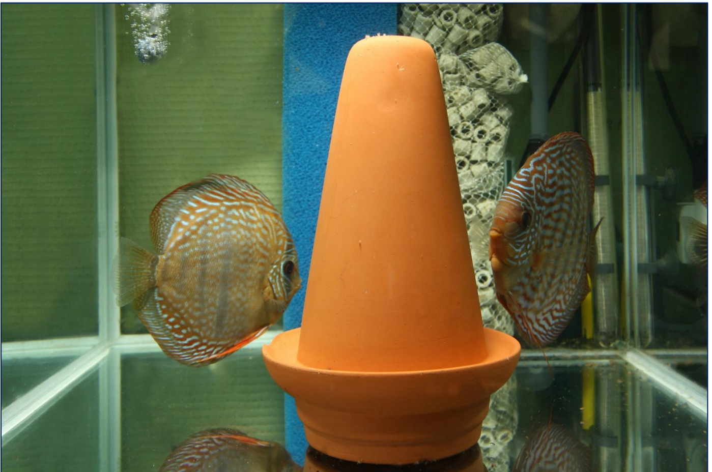
De praktijk in beeld.

De discusvissen starten wel met zijn tweeën een nestje. Uiteindelijk kunnen het er wel een paar honderd discusvisjes geboren worden. Daarom moet je een kweekbak alleen als een tijdelijke oplossing zien! De kweekbak is overigens niet voor niets aan de krappe kant, de kweker hoeft dan minder kweekwater aan te maken en de ouders kunnen de jongen beter in de gaten houden. Ook de jongen hebben voordeel aan de geringe hoeveelheid water omdat zij daardoor makkelijker het voer kunnen vinden.