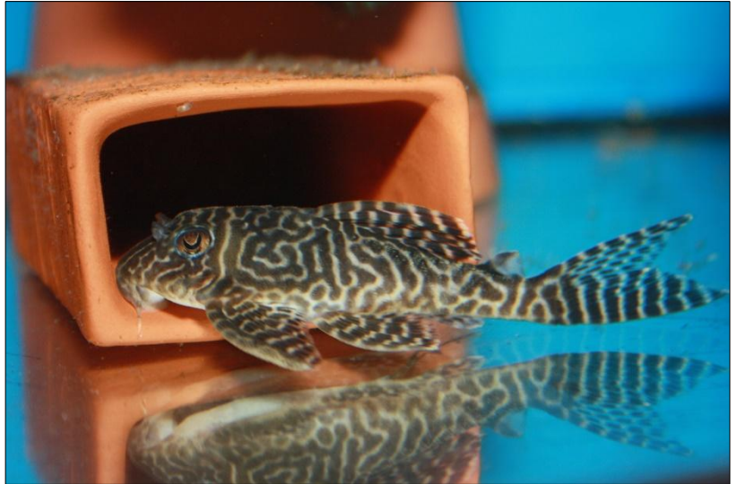
Hypancistrus SP. L410

Sinds een paar maanden ben ik in het bezit van vier wildvang Hypancistrus sp. l410. Ik heb ze gekocht om wat kweekervaring op te doen met L-nummers. De L-nummers zwemmen gewoon rond in mijn discuskweekbakken! De investeringen waren niet al te hoog een paar legholen was meer dan voldoende voor de ouders en de jongen moeten het doen met een paar stukje PVC pijp of een stukje hout.