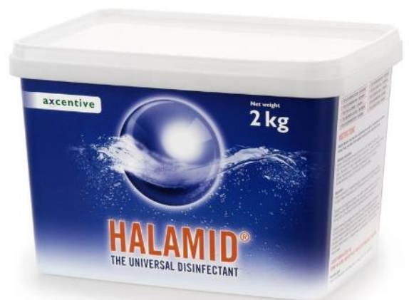
Halamid-d is in verschillende verpakkingsgrootte te koop!

Natuurlijk kan je ook de bekende huis en tuin middelen gebruiken voor ontsmetten van je aquarium. Chloor, bleekwater, zout, azijn, warmtekuur en het droogleggen van het aquarium worden nog steeds gebruikt. Zelfs als deze methoden efficiënt werken kunnen de kleinste concentraties van deze stoffen nog schadelijk zijn voor de installatie en de vissen!