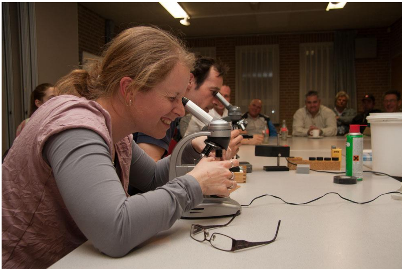
Een DCH-clubavond over herkenning van visziekten en medicatie die een hoop ellende kan voorkomen!