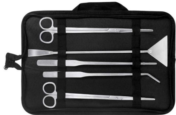
Een aquascaping tool set is alleen handig als het gereedschap droog wordt opgeborgen.

Als wij naar de praktijk kijken wordt het meeste gereedschap onder in de aquariumkast bewaard. Voor mensen die voor meer luxe gaan, is er ook een etui te koop, maar dat heeft het nadeel dat je het gereedschap eerst moet afdrogen voordat je het etui kunt sluiten. Voordeel is, dat er lange accessoires in passen