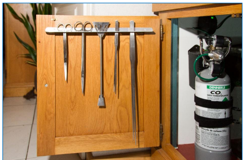
Opgeruimd en gemakkelijk bereikbaar!

Het tekenen van de illustratie heeft veel meer tijd in beslag genomen. Maar ook dat is voor mij een hobby.