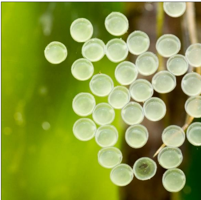
De eerste dag: een defect eitje.

Een dag voor het leggen van de eitjes gaat het paartje het glas algenvrij maken. Zij beginnen in het schemer met het leggen van 80 tot 100 eitjes, waarna na het leggen van de eitjes het mannetje de broedzorg overneemt. Na vier dagen is de dooierzak bijna opgegeten en op het punt staat om uit te komen.