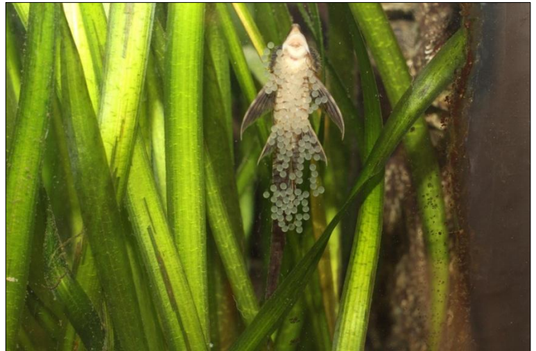
Oeps, ik had de rand van het aquariumglas niet goed schoon gemaakt!

Bij ons zwemmen verschillende generaties Sturisoma Aureum in een 2 meter show aquarium met een netto watervolume van 1000 liter en met een watertemperatuur van 28-30°C. Zij moeten het aquarium delen met discusvissen, altums en vele bijvissen. Het aquarium is rijkelijk voorzien van waterplanten, kienhout en stenen. De aquariumbodem bestaat uit filterzand en hier en daar bedekt met kleine kiezels. Er zwemmen vier volwassen vissen die geregeld jongen voortbrengen. Zij hebben de rechter zijruit (achterhoek) als broedplaats uitgekozen. Daar is relatief weinig stroming aanwezig en worden afgeschermd door de beplanting.