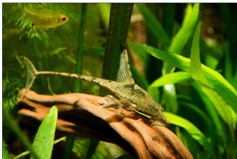
Een vrouwelijke Sturisoma Aureum

De vis heeft een ruim aquarium (>150cm) nodig dat rijkelijk is voorzien van waterplanten, kienhout en stenen. De vis heeft de voorkeur voor een donkere bodembedekking en gematigde verlichting. In de natuur leeft hij in snelstromende riviertjes, dus is enige stroming in het aquarium wel gewenst. De voorkeur gaat naar stevige waterplanten zoals de Zwarte Amazone zwaardplant, Vallisneria en Anubias soorten. Wat je niet mag vergeten is dat bij hem, bij gebrek aan algen, de tere waterplantjes op het menu kunnen staan. Een goed werkend filtersysteem is essentieel omdat de vis gevoelig is voor vervuild water en slechte waterwaarden.