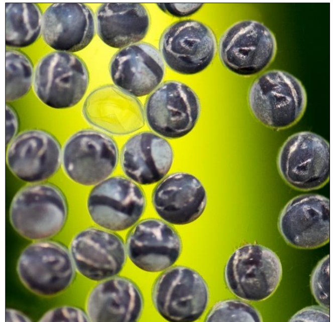
De vierde dag: enkele jongen hebben hun legplaats al verlaten.

Omdat wij de jonge vissen niet in ons show aquarium willen laten opgroeien, verwijderen wij de eitje op de vierde dag. Met een scheermesje schrapen wij de eitjes op van de aquariumruit en vangen ze op met een schepnetje. Omdat de eitjes op het punt staan om uit te komen, verwijder je wel de eitjes maar je vangt uiteindelijk de jongen op.