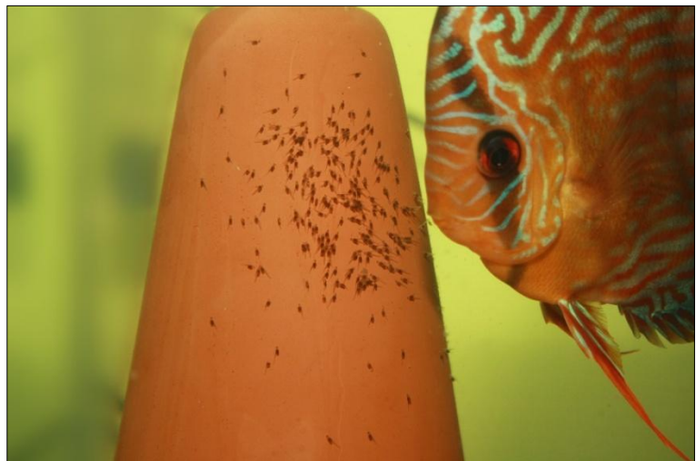
Een keramische afzetkegel staat veel steviger dan een van kunststof!

Omdat de discusvissen hun legsel het liefst in het verticale vlak leggen, is een afzetkegel een goed alternatief voor een natuurlijke omgeving. Zelfs als er voldoende natuurlijke leggelegenheden zijn, zoals: waterplanten en houtstronken, prefereren de meeste discusvissen toch een stabiele afzetkegel.