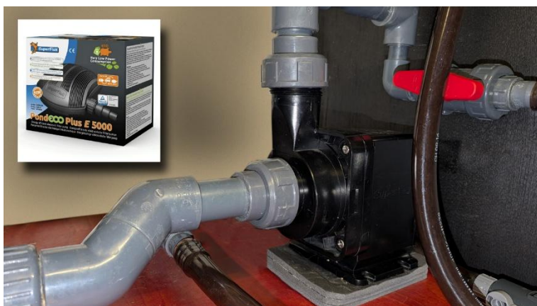
Superfish-Pondeco-Plus-e-5000 is energiezuinige vijverpomp.