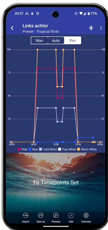
De FluvalSmart App is niet alleen gebruiksvriendelijk maar het biedt voldoende instelmogelijkheden.