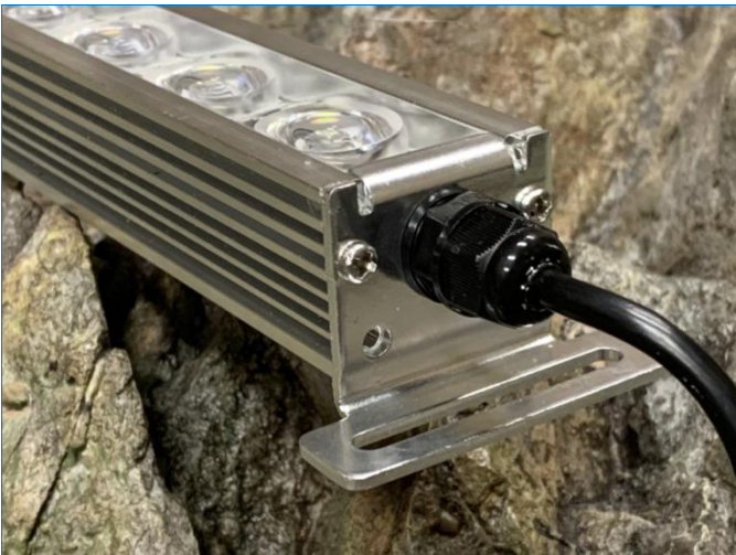
Voor mijn aquaria moets ik verlengkabels gebruiken.

De led controller kon ik alleen met de gebruiksaanwijzing instellen. Dit was erg vervelend als de stoom van de voeding was geweest. Veilig werken tijdens onderhoudswerkzaamheden (verlengsnoer uitzeten) resulteerde altijd met frustratie met de led controller.