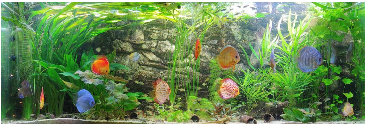
3 x JMB Aqua Led Community: Vermogen: 54 Watt, Lengte: 180 cm, Totaal vermogen 162Watt, Brandtijd: 12 uur per dag.