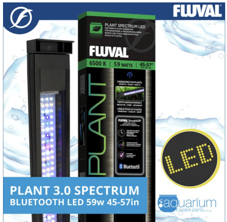
De Fluval Plant 3.0 biedt een helderder, intenser licht in vergelijking met de Fluval Plant 2.0.