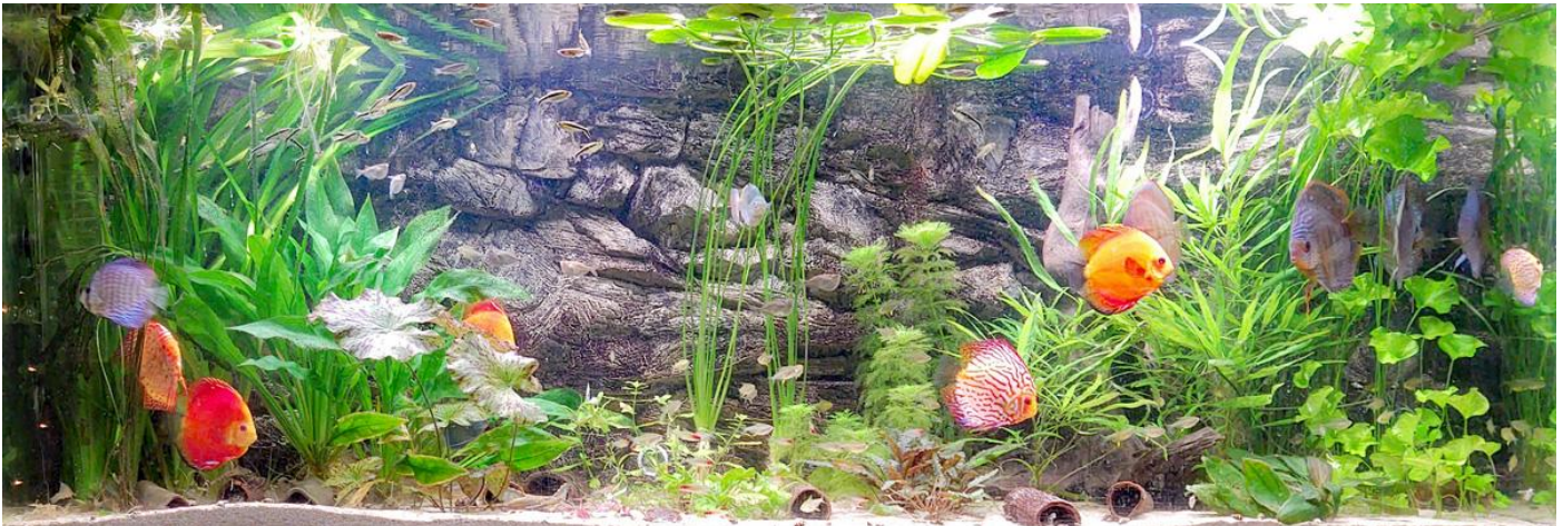
4 x Fluval Plant spectrum LED: Vermogen 46 Watt, Lengte 91-122 Totaal vermogen: 184 Watt, Brandtijd: 12 uur per dag.

De FluvalSmart App is niet alleen overzichtelijk maar ook vriendelijk in gebruik. Je kan eenvoudig het kleurenspectrum en de lichtsterkte instellen. Daarnaast zorgt een programmeerbare 24-uurs lichtcyclus voor geleidelijke zonsopgang, zonsondergang en nachtinstellingen voor een echt natuurlijk effect.