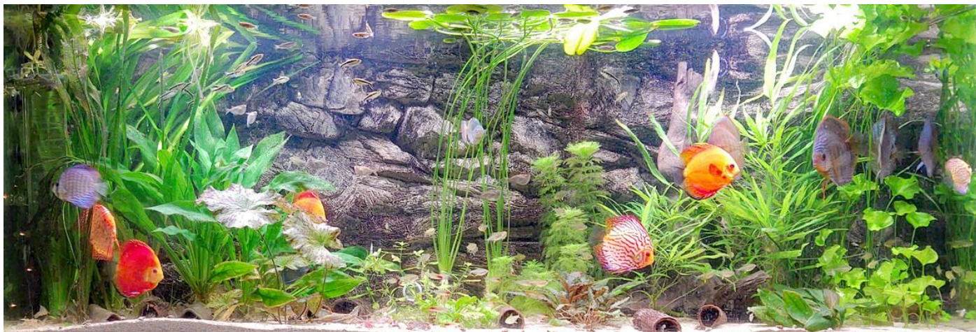
4 x Fluval Plant spectrum LED: Vermogen 46 Watt, Lengte 91-122 Totaal vermogen: 184 Watt, Brandtijd: 12 uur per dag.

De FluvalSmart App is niet alleen overzichtelijk maar ook vriendelijk in gebruik. Je kan eenvoudig het kleurenspectrum en de lichtsterkte instellen. Daarnaast zorgt een programmeerbare 24-uurs lichtcyclus voor geleidelijke zonsopgang, zonsondergang en nachtinstellingen voor een echt natuurlijk effect.