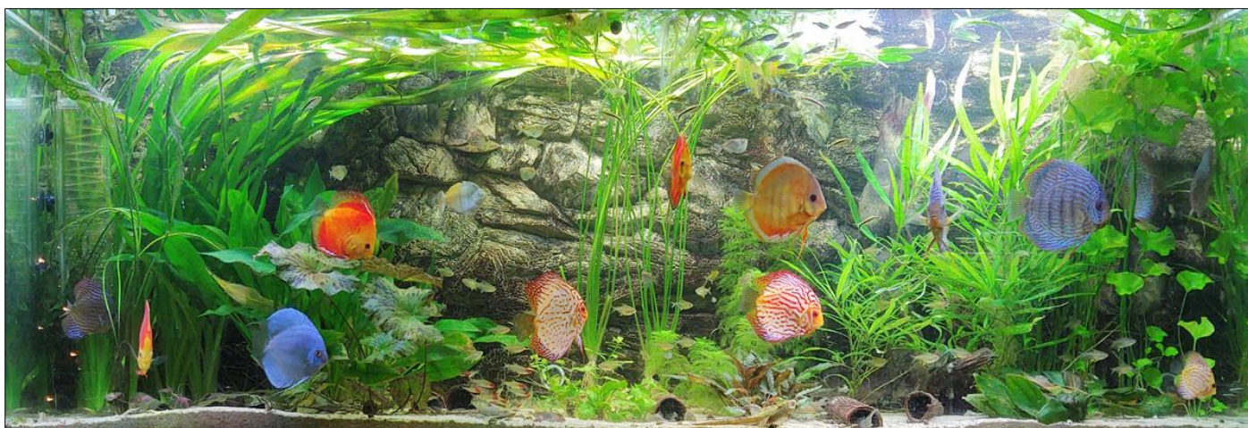
3 x JMB Aqua Led Community: Vermogen: 54 Watt, Lengte: 180 cm, Totaal vermogen 162Watt, Brandtijd: 12 uur per dag.