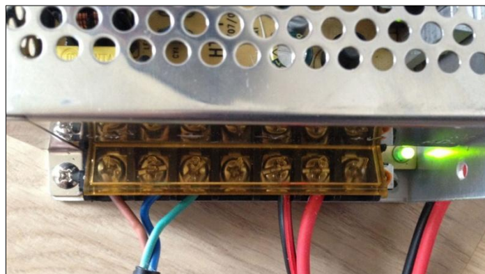
Dit mag je geen veilige voeding noemen voor aquariumverlichting