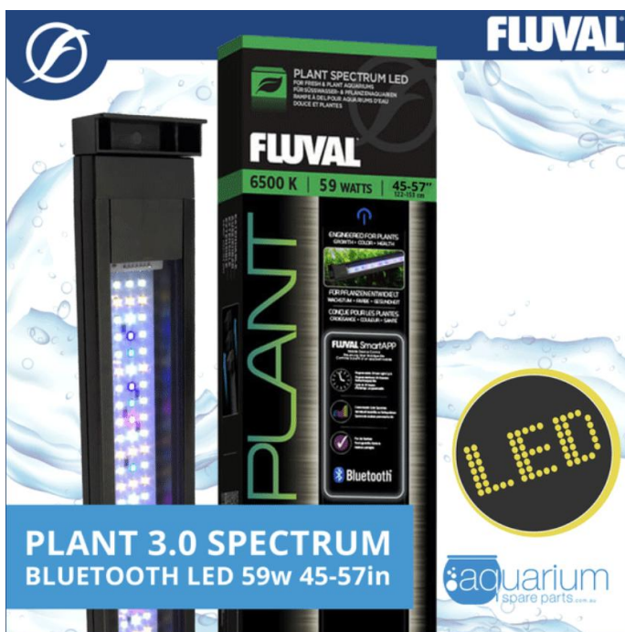
De Fluval Plant 3.0 biedt een helderder, intenser licht in vergelijking met de Fluval Plant 2.0.