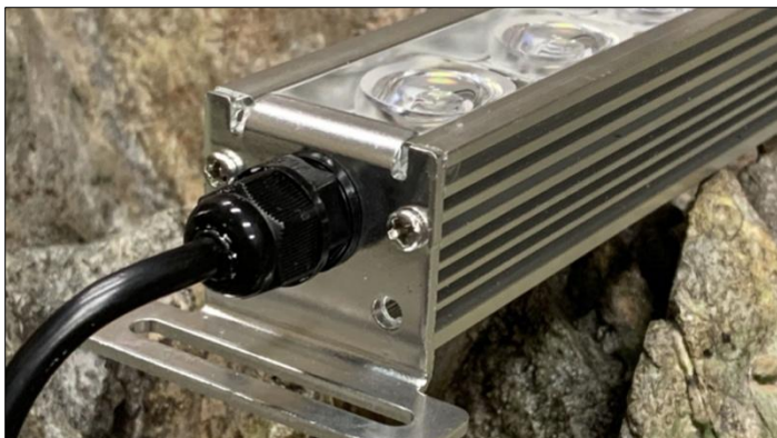
Voor mijn aquaria moest ik verlengkabels gebruiken.

De led controller kon ik alleen met de gebruiksaanwijzing instellen. Dit was erg vervelend als de stroom van de voeding was geweest. Veilig werken tijdens onderhoudswerkzaamheden (verlengsnoer uitzeten) resulteerde altijd met frustratie met de led controller.