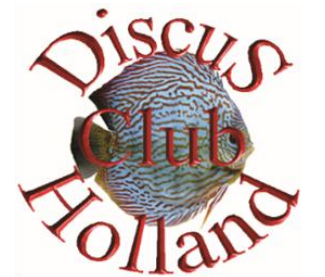
DCH logo 1998 tot 2008

dat een paar mensen bij elkaar zijn gaan zitten om eens na te denken over het opzetten van een vereniging bedoeld voor discusvissen liefhebbers. Het doel wat we toen stelden was zoveel mogelijk informatie verzamelen over de discusvis en vooral delen met andere liefhebbers. De oprichting was op 9 mei in café Den Engh in 't Goy. Er waren 94 bezoekers.