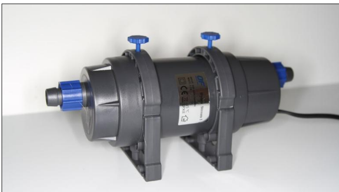
Free Ocean Stream 1 met Hydro-Pure Technology

Lees meer over: Praktijktest Hydro-Pure Technology