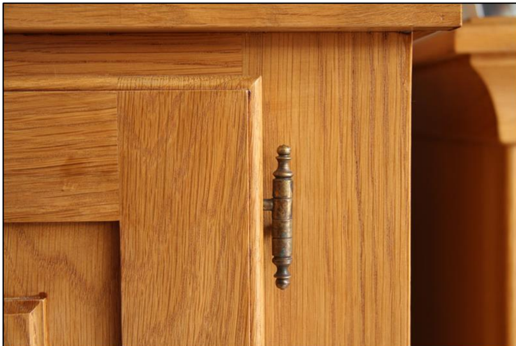
Details afgelakte opdekeur

* Het afwerken van massieve eiken kastdelen is een serieuze zaak. Het hout moet namelijk wel kunnen ademen, zodat het vocht ook uit het hout kan verdampen. De grootste fout die je kunt maken is het hermetisch afsluiten van het hout doormiddel van een laklaag. Door temperatuurverschillen gaat het hout werken (uitzetten en krimpen) met het gevolg dat de laklaag gaat scheuren. Op zich is dat niet zo erg zolang het hout maar kan ademen. Kan het hout niet goed ademen dan gaat het hout rotten. De eerste tekenen zijn zwarte plekken onder de laklaag en het afbladeren van de laklaag.