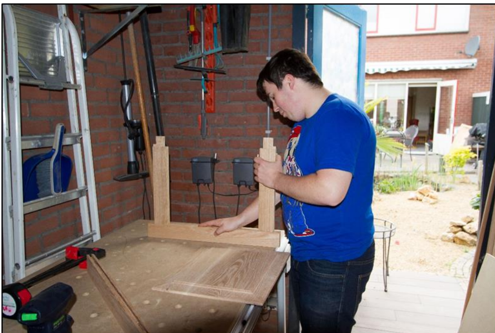
De deur liggers passen.

Het binnenpaneel wordt niet aan het deurliggers verlijmd maar in de binnenste groef van de liggers en staanders geplaatst. De kunst is de panelen zo op maat te maken dat deze nog kunnen bewegen binnen de groeven van de liggers en staanders. Op deze wijze wordt er rekening gehouden met uitzettingscoëfficiënt van het hout. Na het bepalen van de exacte buitenmaten van het binnenpaneel wordt het paneel op maat gezaagd en voorzien van de gewenste profielen.