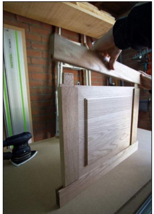
Het proefdraaien voor het verlijmen. De standers zijn nog inkorten!