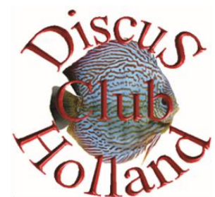
DCH logo 1998 tot 2008

Er kwamen steeds meer leden en onze vereniging groeide gestaag. Het aanbod deed zich voor om in Het Haltnahuis in Houten de ontvangsthuis en bijruimten mochten gaan gebruiken. Dat was in het jaar 2000.