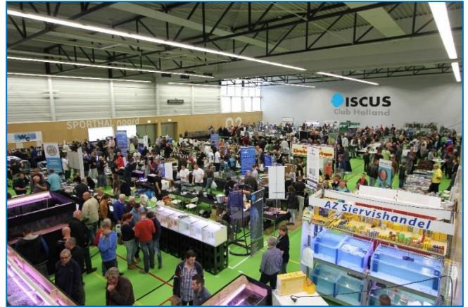
Zaterdag 21 april 2014: Geen gebrek aan belangstelling

In het organiseren van een wedstrijd was de kennis wel in huis, maar het organiseren van een beurs was niet onze sterkste kant. En zo ontstond er een samenwerking met aquarium vereniging Daphnia die weer erg goed waren in het organiseren van een beurs en ook nog eens de nodige vrijwilligers kende. We konden samen goede afspraken maken en zo werd in 2014 een discusshow gegeven met een grotere beurs in het nieuwe Helsdingen in Vianen onder de naam AquaVaria, ons samenwerkingsverband in een nieuw sportcomplex dat groter is dan het oude. Gelukkig waren er een aantal vrijwilligers die ons veel werk uit handen hebben genomen. Maar daar blijft het niet bij. Als we dan toch vooruit willen, doe het dan goed! En zo zal op 24 en 25 oktober 2015 een heus Wereld Kampioenschap Discusvissen georganiseerd worden tijdens het evenement AquaVaria. En natuurlijk hartstikke samen met aquarium vereniging Daphnia. Het voornemen is hiervoor 150 wedstrijd bakken voor te laten aanrukken en, zo als het er nu uitziet, zes klassen. Deze getallen zijn voorlopig definitief, maar kunnen nog veranderen. Daarnaast zal ook De NVC en de NBAT het een en ander gaan organiseren en aanschuiven op AquaVaria.