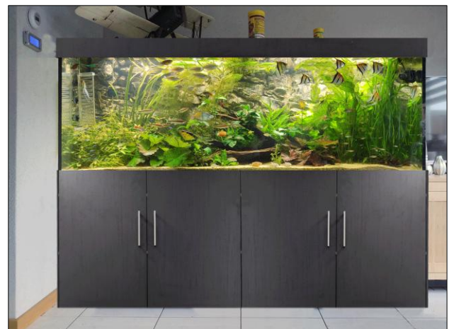
De nieuwe aquariumkast