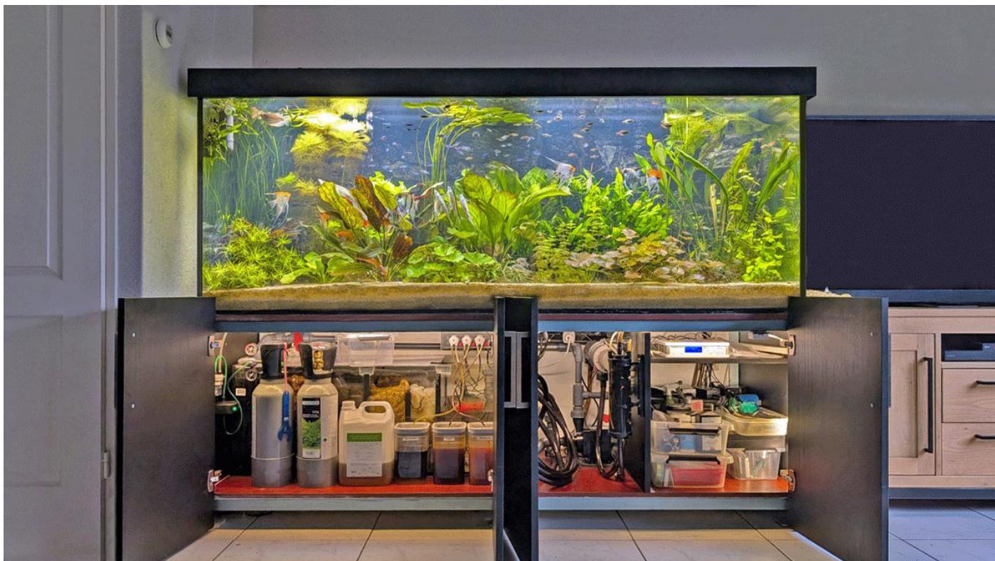
De techniek aan de binnenkant.