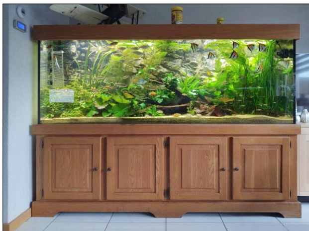
De oude aquariumkast

Het eerste ontwerp van de aquariumkast had dezelfde stijl van de nieuwe meubels. Door een ander ontwerp te creëren wordt het zichtveld onder het frame ontnomen. Bij het nieuwe ontwerp lopen de deuren door tot de grond en past de zwarte kast beter bij de nieuwe huisstijl. De lampen, deurkrukken, stopcontacten en schakelaars hebben zwart uiterlijk gekregen.