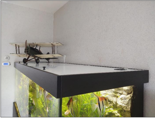
De nieuwe lichtkap