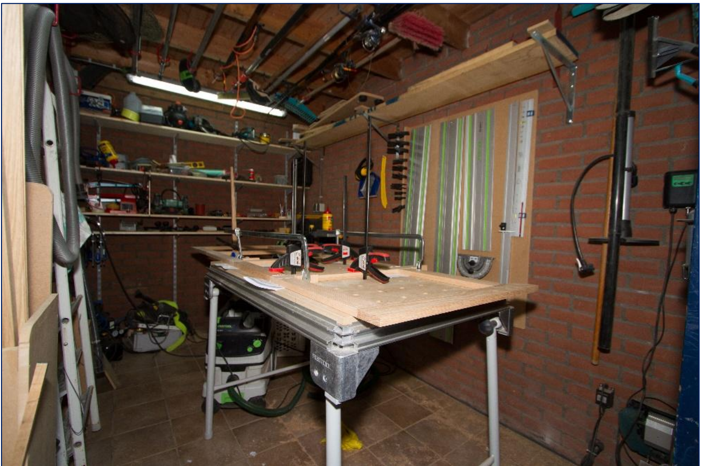
Wachten totdat de lijm is uitgehard.