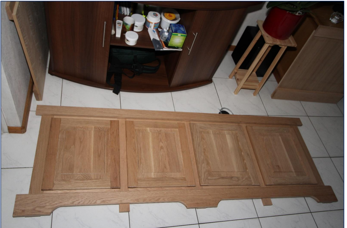
De boven -en onderplint zijn nog niet op de gewenste breedte gezaagd. Dit kan pas gebeuren als de zijpanelen op het stalen frame zijn geplaatst.