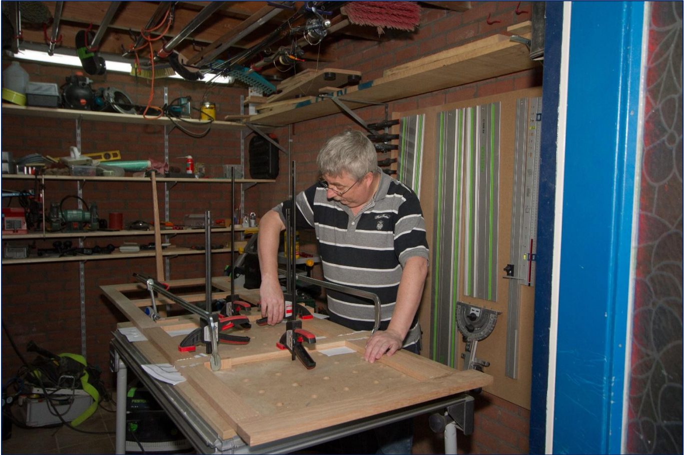
Het verlijmen van het voorpaneel op een Festool multifunctionele MFT 33 tafel is een fluitje van een cent. Het Festool domino systeem zorgt er voor solide constructie, die zelfs niet kan verschuiven tijdens het verlijmen.