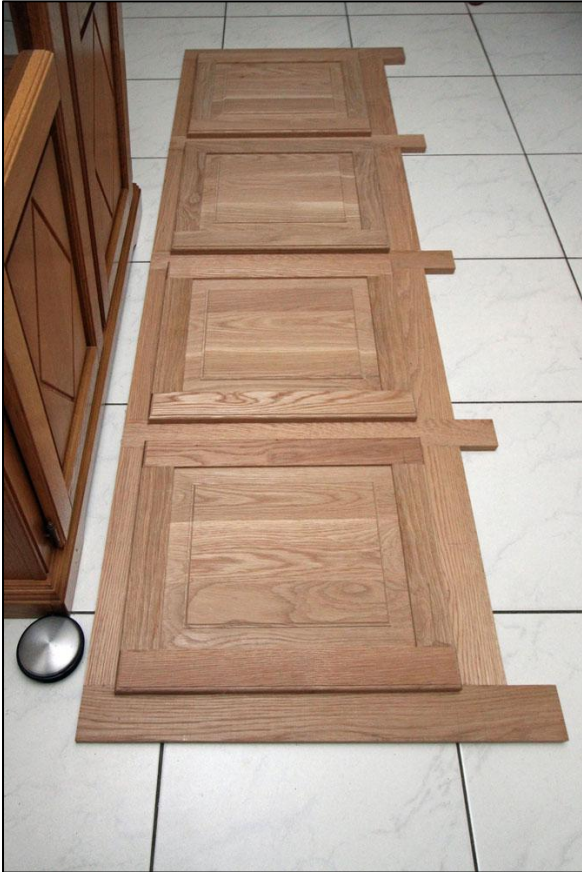
Het voorpaneel zonder boven -en onderplint maar wel met de kastdeurtjes ter illustratie.