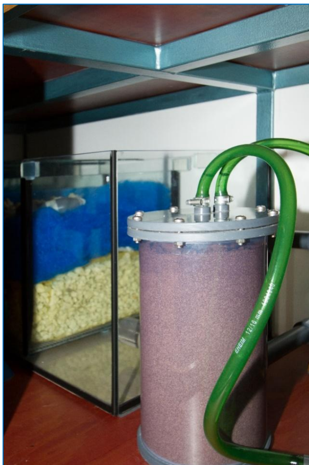
De wanden van het natte gedeelte van de onderkast is voorzien van formica en is rondom afgekit met siliconenkit.