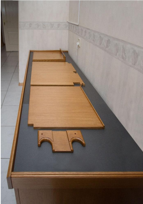
Alle binnenpanelen en de verhoging voor de aanvoerpomp.

De onderkast bestaat uit twee compartimenten. Het natte gedeelte is voorzien van formica en het droge gedeelte is van eiken gemaakt. In het droge gedeelte komt een aquarium computer (Profilux 3 ex) die de hardware van het aquarium aanstuurt.