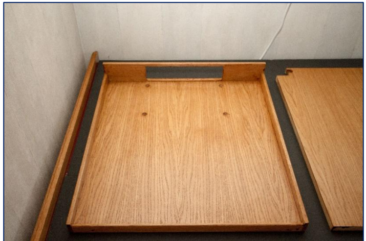
De legplank voor de Profilux 3 ex