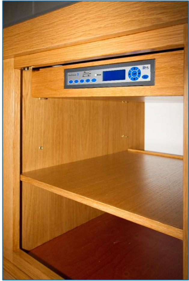
Het droge gedeelte van de onderkast met de Profilux 3ex.