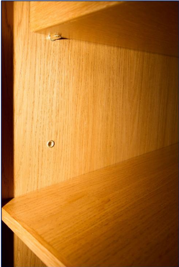
De planken kunnen op verschillende hoogte worden geplaatst.