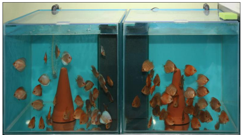
De aller jongste discusvisjes kan je efficiënter voeren in een aquarium met beperkte zwemruimte.

Omdat wij de kweekbak zelfstandig kunnen laten draaien op het intern filtersysteem, kunnen wij de zieke vissen gemakkelijk behandelen. Het enige probleem is dat de biologische werking van het interne filtersysteem, meestal om zeep wordt geholpen door de medicatie. Het interne filtersysteem fungeert eigenlijk alleen als mechanisch filtersysteem!